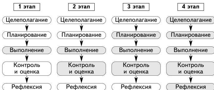
Рис. 3. Этапы формирования УУД, являющихся структурными элементами учебной деятельности

Можно выделить 4 этапа формирования УУД данного вида (рис. 3). Цветом обозначены этапы, которые учащиеся выполняют самостоятельно.