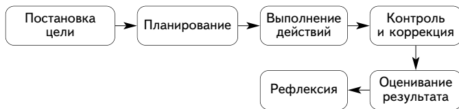
Рис. 2. Структура учебной деятельности

Учебная деятельность имеет определенную, четко заданную структуру (рис. 2).