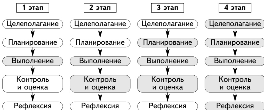
Рис. 3. Этапы формирования УУД, являющихся структурными элементами учебной деятельности

Можно выделить 4 этапа формирования УУД данного вида (рис. 3). Серым цветом обозначены этапы, которые учащиеся выполняют самостоятельно.